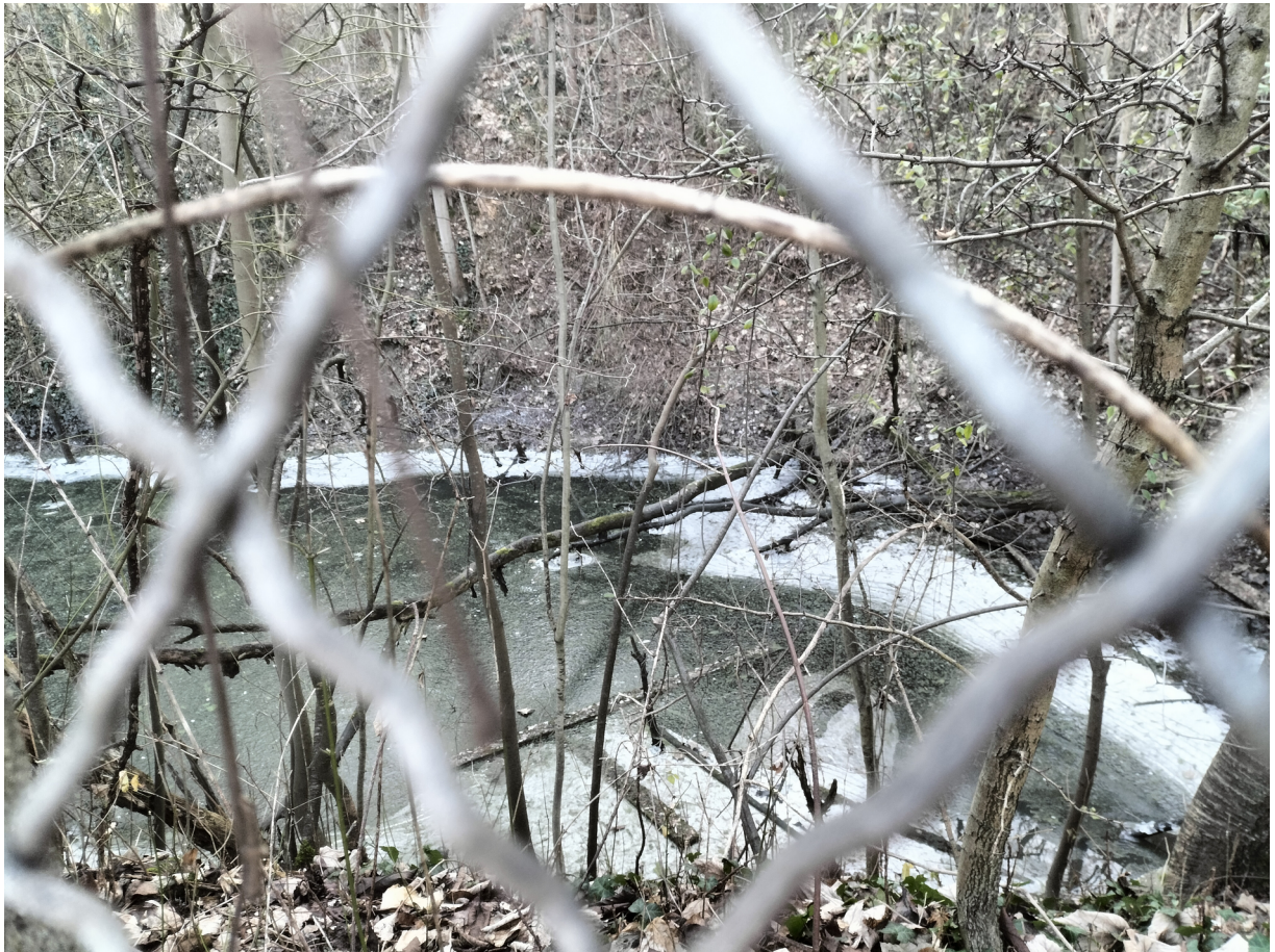
Photos du bassin D07 , accès difficile